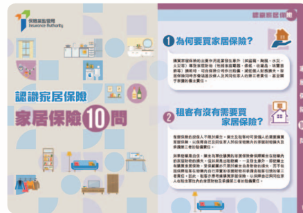
有關家居保險的電子小冊子