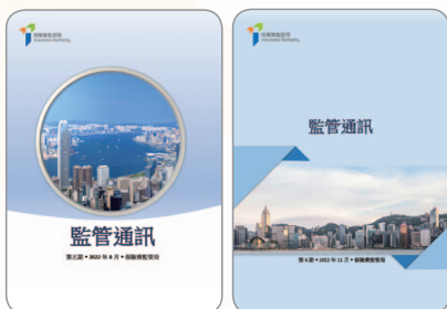
以《監管通訊》協助教育公眾從處理投訴中所得出的「經驗教訓」