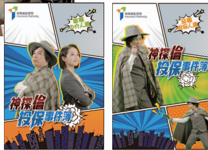
以短片及漫畫提醒保單持有人有關投保或保單管理的盲點