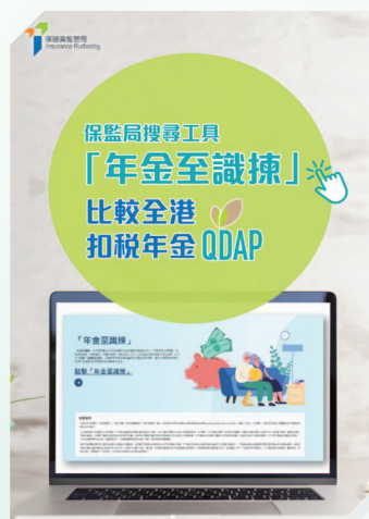
宣传一站式搜寻工具「年金至识拣」