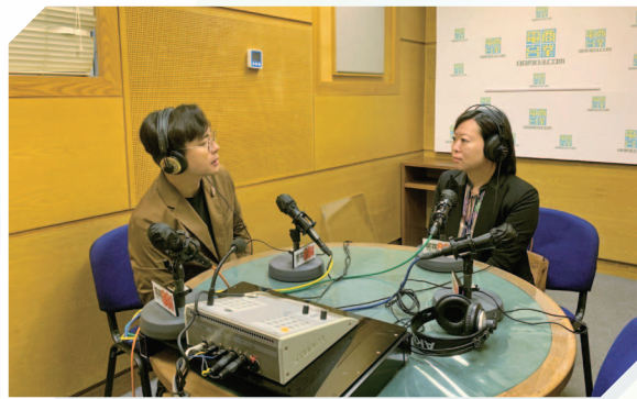
在电台节目系列介绍有关投资相连寿险计划及保障型投资相连寿险的重要信息